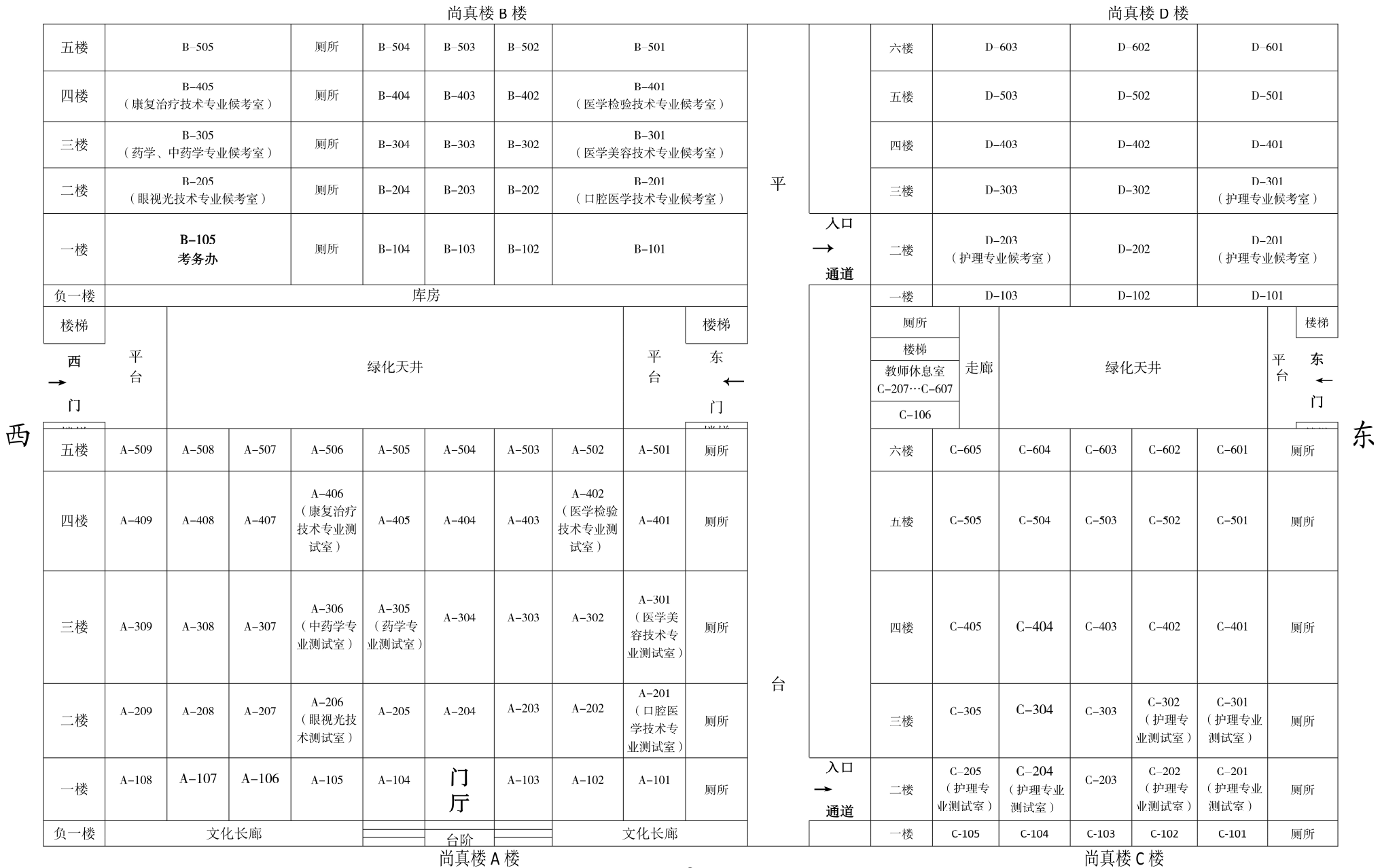
皖西卫生职业学院 2024 年分类招生考试职业技能考试考场分布图