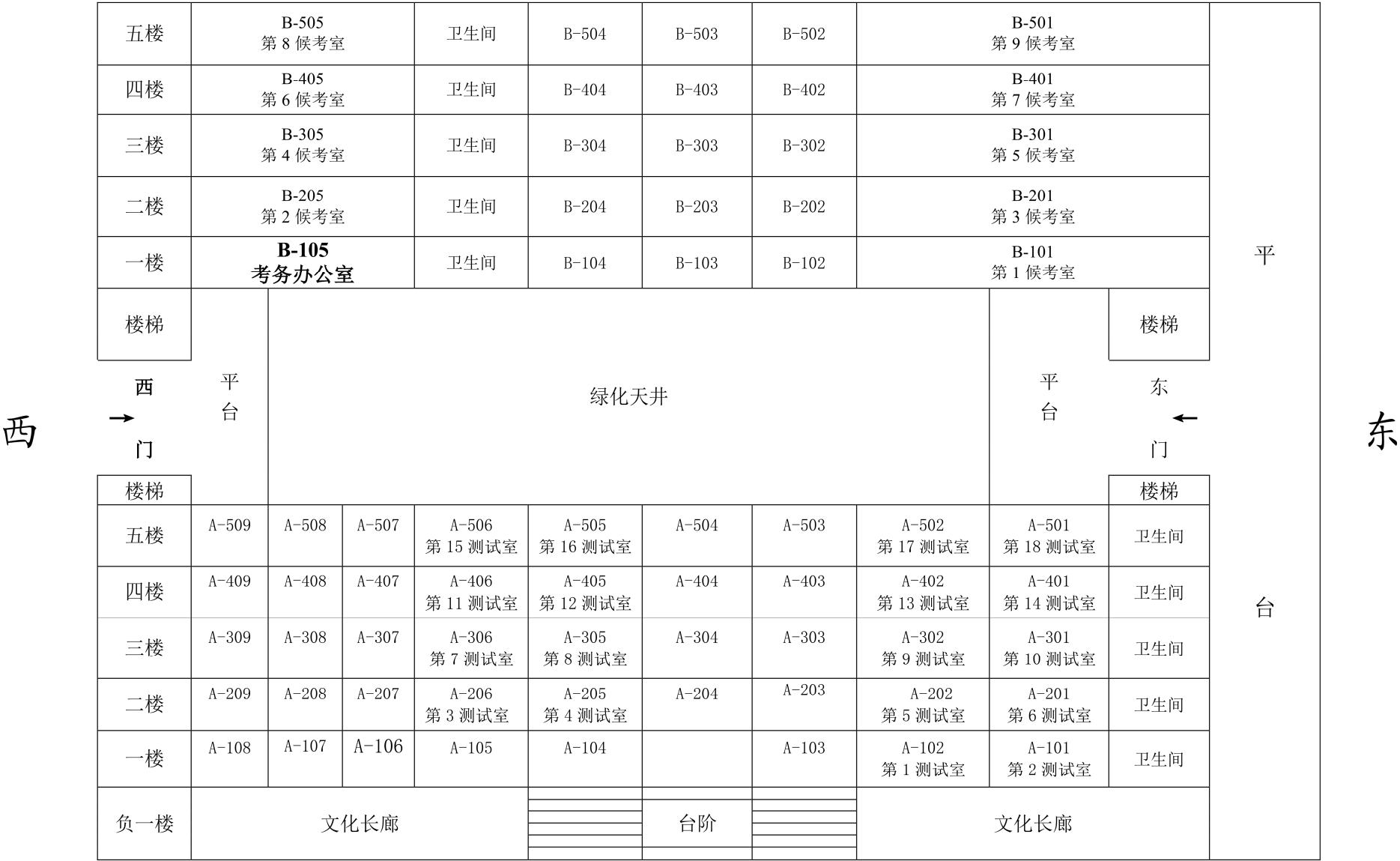
尚真楼 A 楼