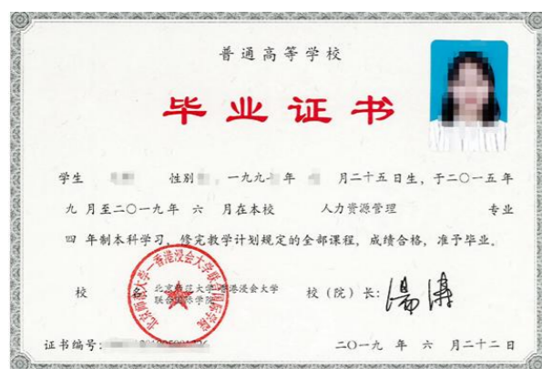
北京师范大学-香港浸会大学联合国际学院本科毕业证书 (教育部电子注册)

北师港浸大学生经四年在校学习，达到毕业要求及学士学位授予条件，即获颁北京师范大学-香港浸会大学联合国际学院本科毕业证书（考取内地研究生及公务员均可）和香港浸会大学学士学位证书（内地、香港及国际范围均获认可）。