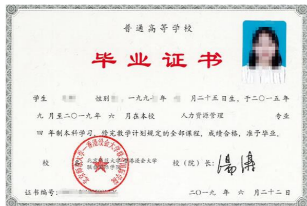
北京师范大学-香港浸会大学联合国际学院本科毕业证书 (教育部电子注册)

北师港浸大学生经四年在校学习，达到毕业要求及学士学位授予条件，即获颁北京师范大学-香港浸会大学联合国际学院本科毕业证书（考取内地研究生及公务员均可）和香港浸会大学学士学位证书（内地、香港及国际范围均获认可）。