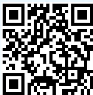
说明会及一对一指导预约二维码