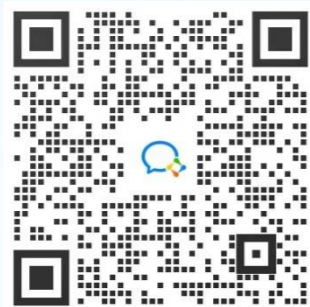
扫码加入微信咨询群